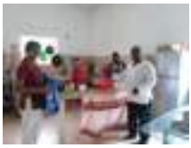
Rawang, Melaka, Senawang, Johor Bahru, Singarope