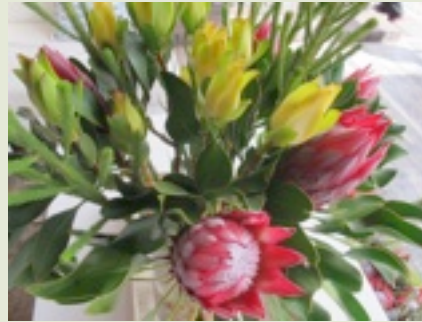
Kuningasprotea Etelä-Afrikan kanssaliskukka

Sanoin virkailijoille että maksan tietysti kaikki kulut ylimääräisestä laukusta, mutta se ei ollutkaan ihan niin helppoa kuin luulin. Kävimme lippukassalla ja sieltä taas takaisin lippuselvitykseen. Koko ajan rukoilin ja odotin jotain tapahtuvaksi. Nyt tunsin kuinka koin ihan sisäistä paniikkia siitä että en pääsisikään pois tästä maasta, joten sanoin että maksan ihan mitä vaan kunhan pääsen lähtemään. Lopulta kentän johtaja tuli ja sanoi sinä voit nyt lähteä ja että sinun ei pidä maksaa laukuista mitään. Kiitin johtajaa tästä upeasta siunauksesta ja tietysti Herraa! Sitten juoksin matkavatara selvitykseen ja sieltä tarkastus aseman toiselle