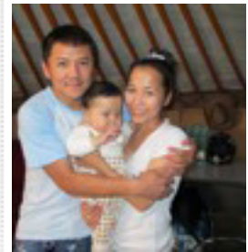
Binder, Urnaa ja vauva Sorbileg

Ihmiset hämmästyivät nähdessään, kuinka mykät puhuivat, raajarikot tervehtyivät, rammat kävelivät ja sokeat näkivät, ja he ylistivät Israelin Jumalaa. Matt. 15:31