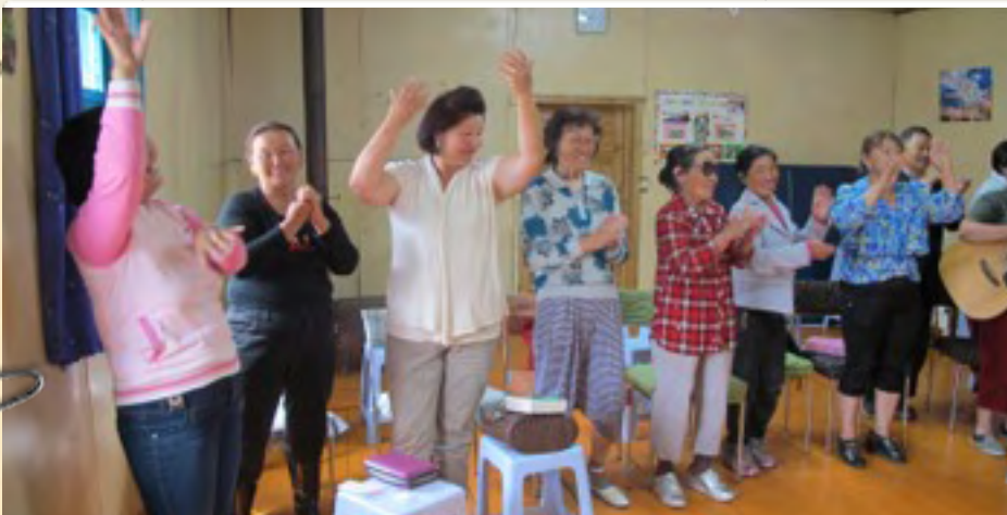
Pyhän Hengen iloa... Hallelujaaa

Nyt matka ja missio jatkuu Suomessa seuraavan kuukauden tai kahden aikana ja sitten taas Amerikkaan....<3<3<3 sivu 7