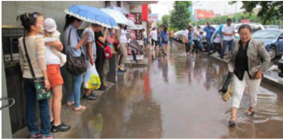
Sade yllätti meidät kaupungissa