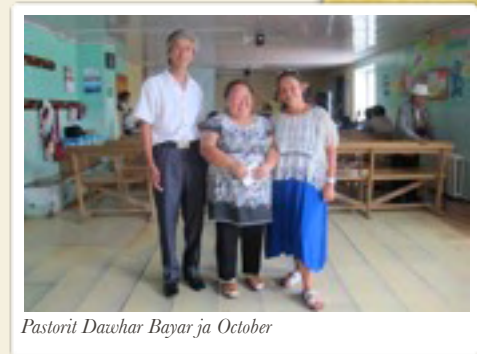
Pastorit Dawhar Bayar ja October

Sinä osoitat minulle elämän tien. Minä saan nähdä sinun kasvosí, sinä täytät minut ilolla. Ap.t. 2:28