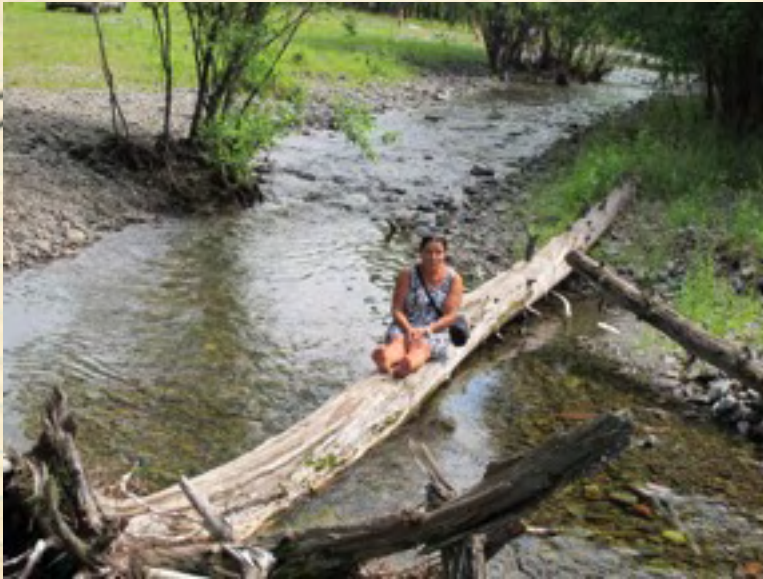
Evankeliumia maailmalle... lepoetki Mongolian kauniissa luomossa