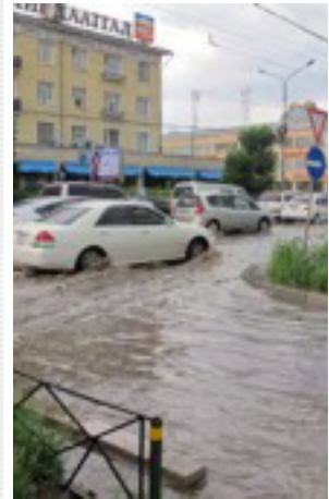
Autoinkin joutuivat koviille...