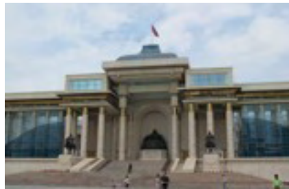
Ulaanbaatar ja Chinggis Khaan'in patsas