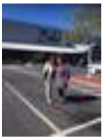
San Francisco ja Redding Kalifornia USA