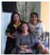
Sabah, Borneo Itä Malesia ja Manila Quezon city, Filippiinit