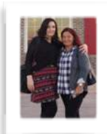
Tallahassee Clearwater Houston Redding Usa

Kuinka ihanat ovat sinun asuinsijasi, Herra Sebaot! Minun sydämeni näntyy kaipauksesta, kun se ikävöi Herran temppelin esipihoille. Minun sieluni ja ruumiini kohottaa riemuhuudon, kun tulen elävän Jumalan eteen. Ps. 84