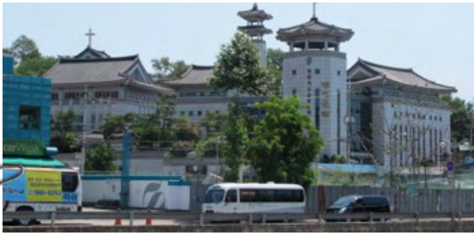
Maecenas pulvinar sagittis enim. Jang Seok Presbyterian Church