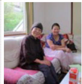
Estherin luona rukotlemassa

“Minä olen maailman valo. Se, joka seuraa minua, ei kulje pimeässä, vaan hänellä on elämän valo.” John.8:12