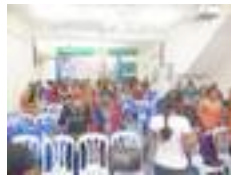
Kuala Lumpur, Malesia