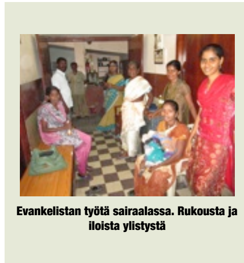
Evankelistan työtä sairaalassa. Rukousta ja iloista ylistystä

Työ Intiassa on tuonut satoja Jeesukselle Parantumisia ja