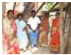
Intia & Sri Lanka