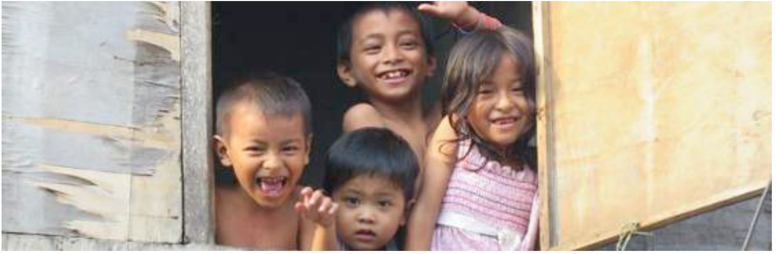
Jeesus sanoo rukoilkaa näin : Maanpäällä niin kuin taivaassa <3