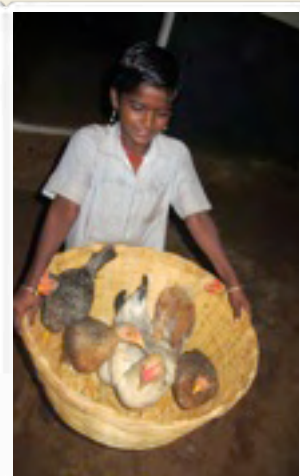
Nukkumaan meno aika