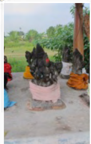
Käsin tehtyjä Jumalia...