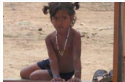
Vengayavelur'in lapsi ovan suulla