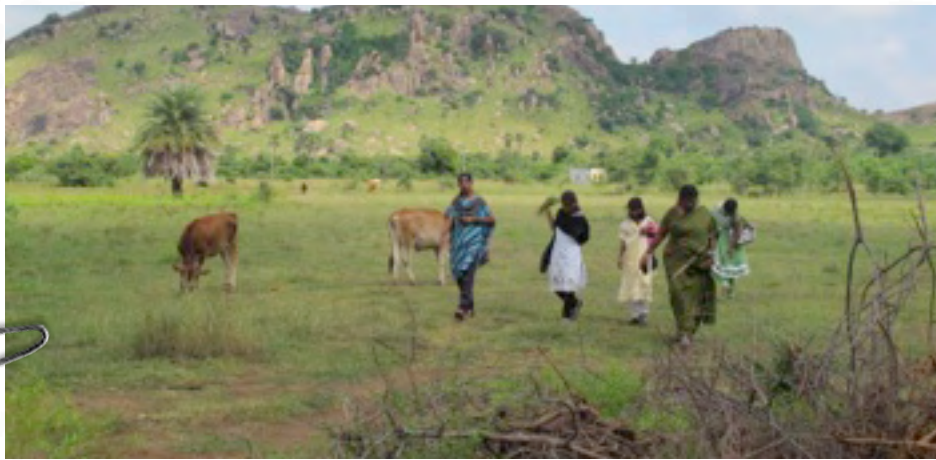
Tässä kuva Beatitudes vuoren juurelta Intiasta..