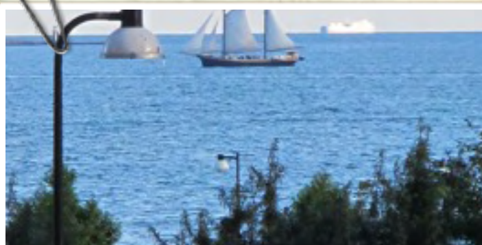
HERRA TÄYTTÄÄ MEIDÄN SIELUT NIIN KUIN PURJEET