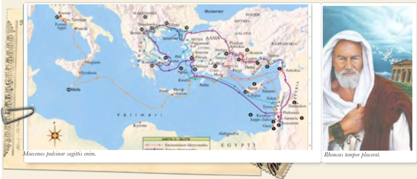
Maecenas pulvinar sagittis enim.